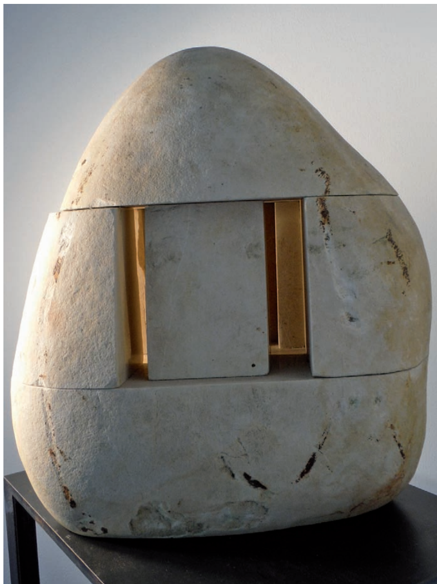
Deconstrucción N.º 518 Luz Interior, 2020