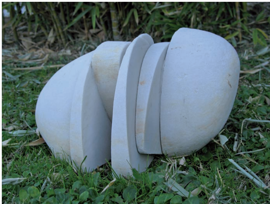
Deconstrucción N.º 49 Cabeza Girada, 2007