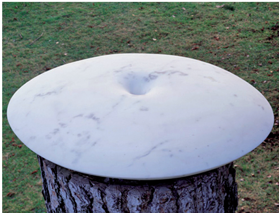
Torso N.º 31 , 1997