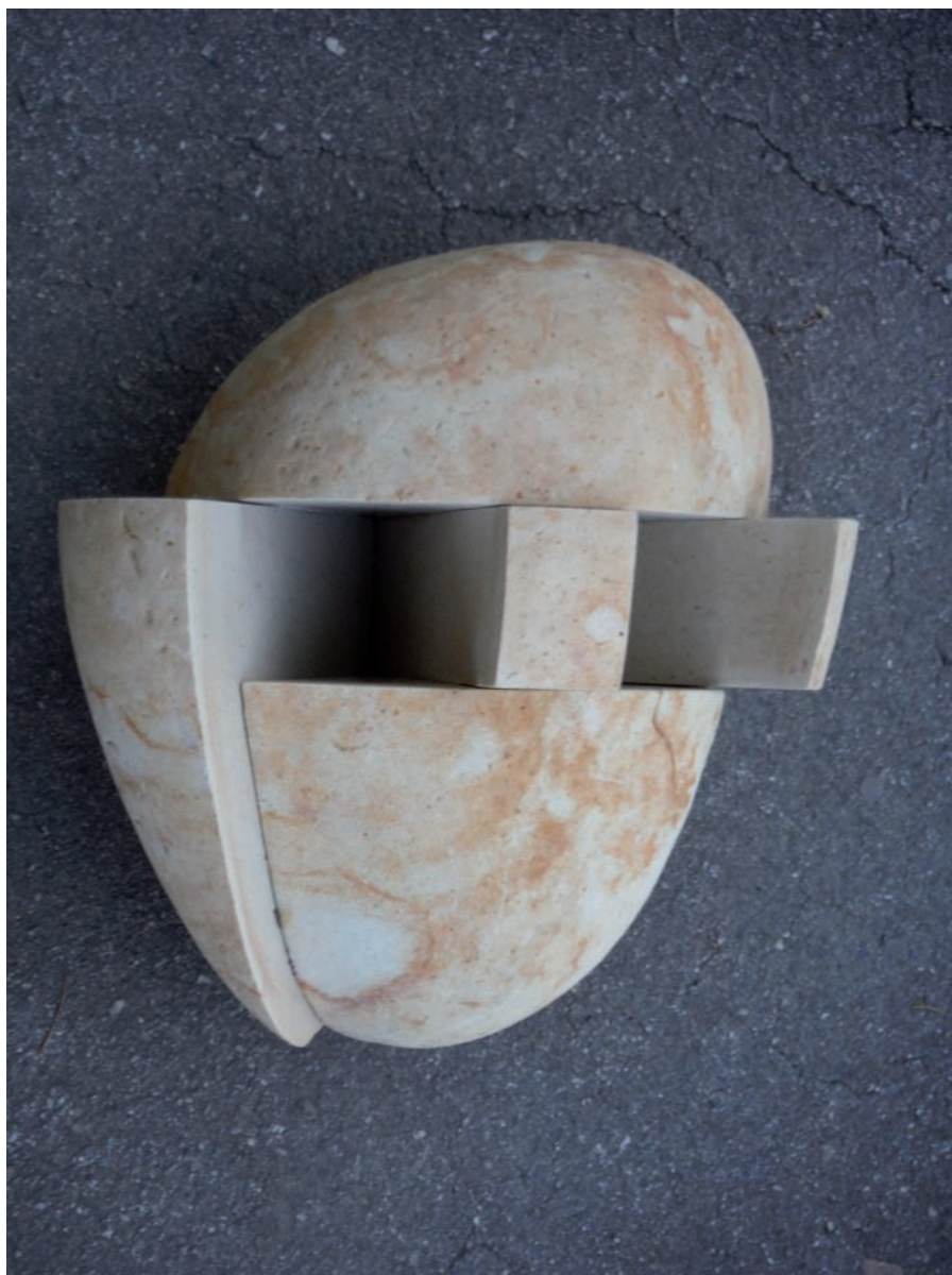
Deconstrucción N.º 454, 2016