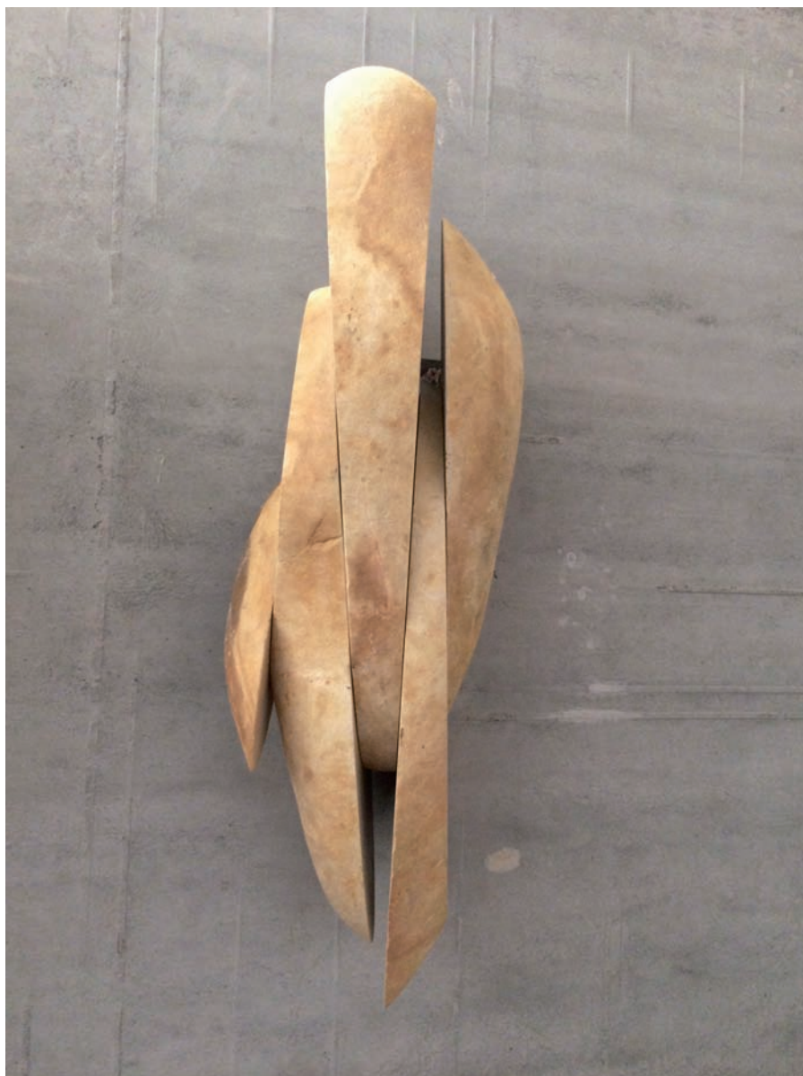
Deconstrucción N.º 478 , 2017