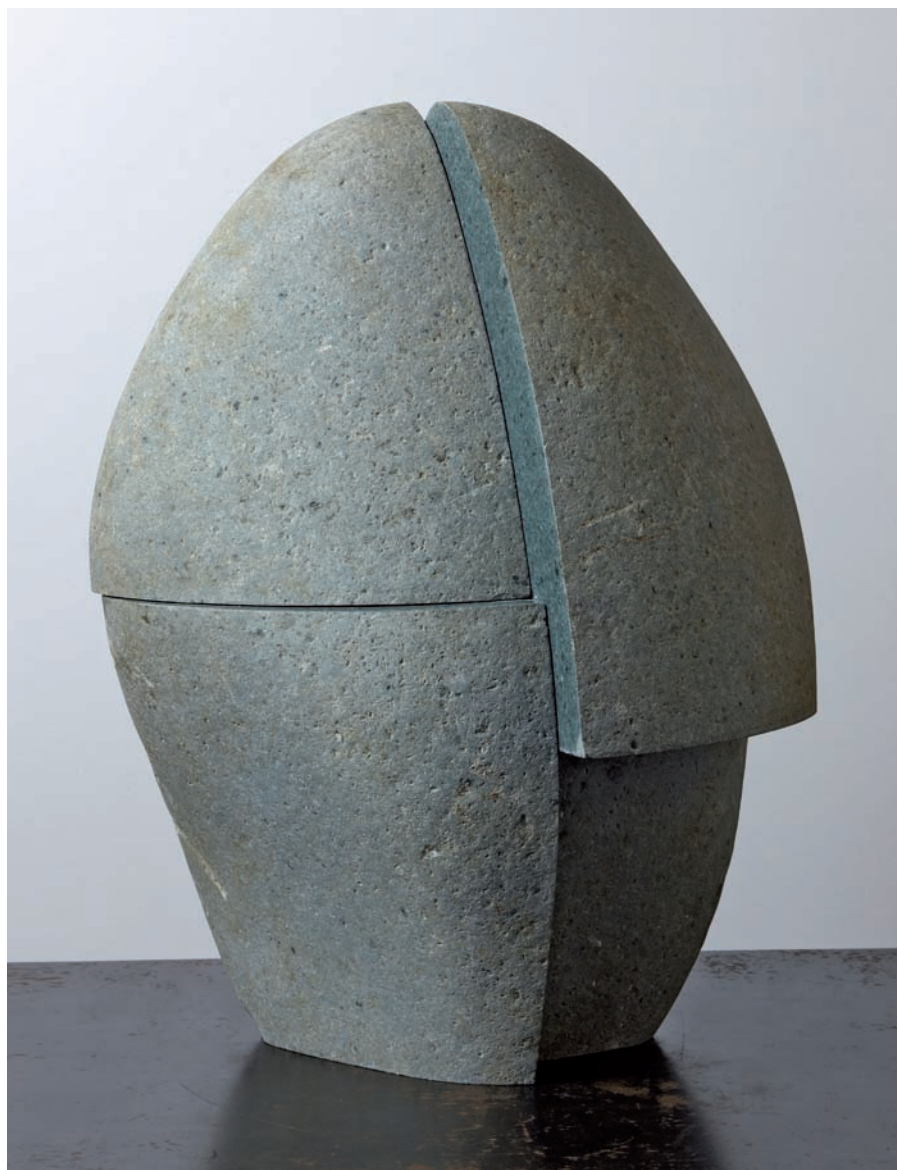
Deconstrucción N.º 233 Cabeza, 2010